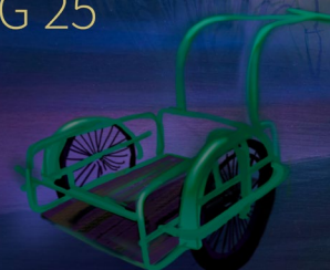
Laboratoire Atmosphérique #3