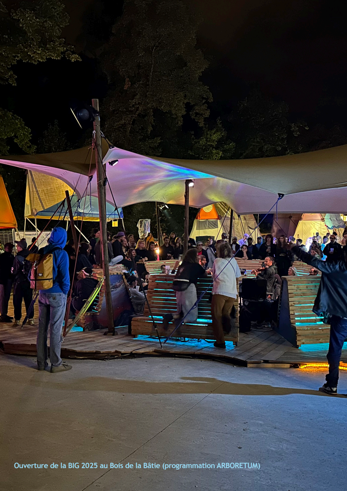
Ouverture de la BIG 2025 au Bois de la Bâtie (programmation ARBORETUM)