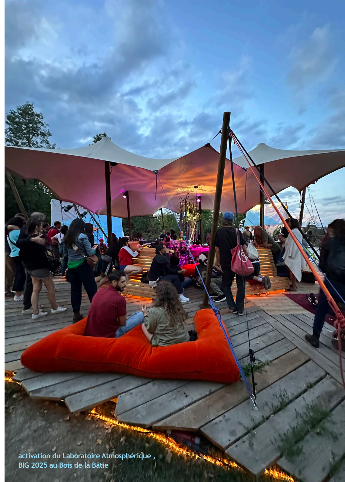
activation du Laboratoire Atmosphérique , BIG 2025 au Bois de la Bâtie

Utiliser le médium de l'art comme vecteur universel de cohésion sociale.